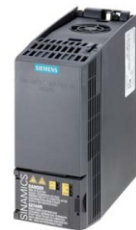
Иллюстрация аналогичная / Figure similar