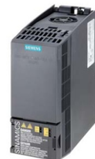
Иллюстрация аналогичная / Figure similar